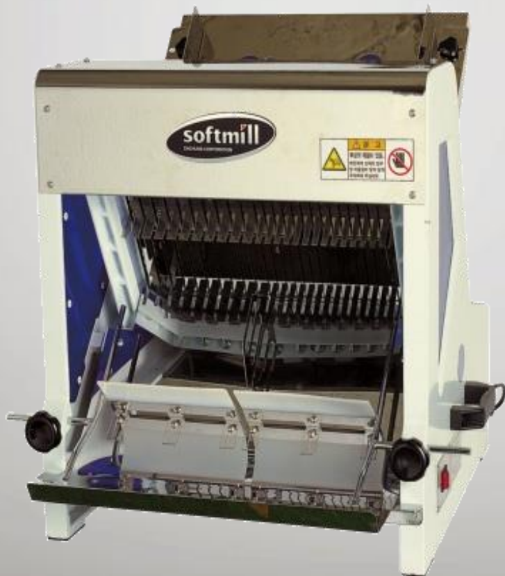
MODEL : DHBS-10