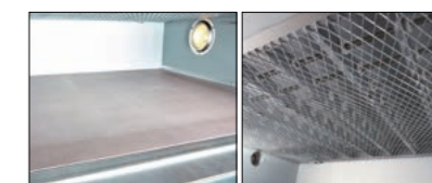
▶ Differentiated steam device ◀