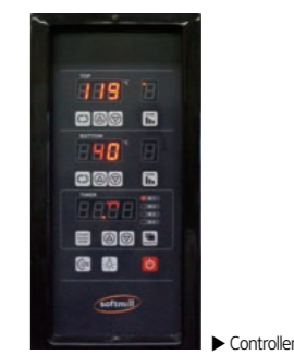
▶ Controller ◀